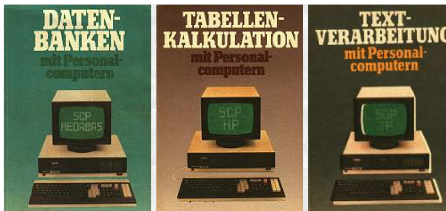
Abbildung 1: Computer „Robotron 1715“, der Standard-Bürorechner in der DDR