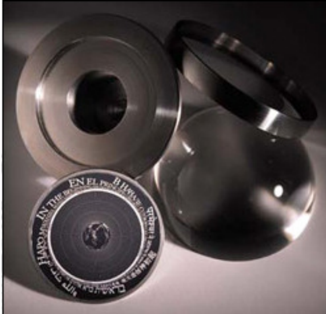
Abbildung 2: Rosetta Disc mit Container